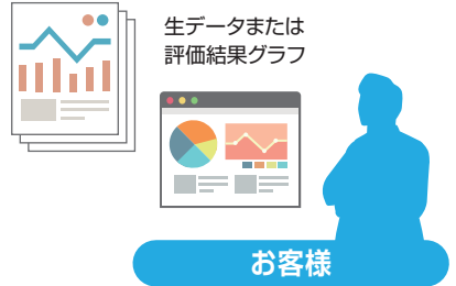
受託評価内容 一例